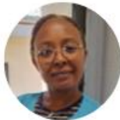
ZOHRA Agent polyvalent service & garderie